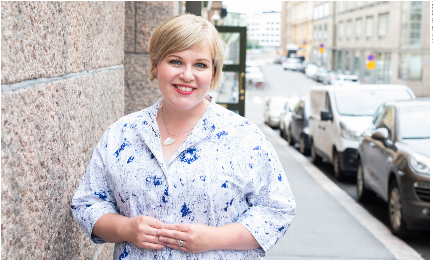
”Työllisyyden paraneminen edellyttää, että myös elinkeinoelämämme kykenee uudistumaan ja investoimaan”, sanoo tiede- ja kulttuuriministeri Annika Saarikko.

tella Suomeen entistä aktiivisemmin myös ulkomailta.