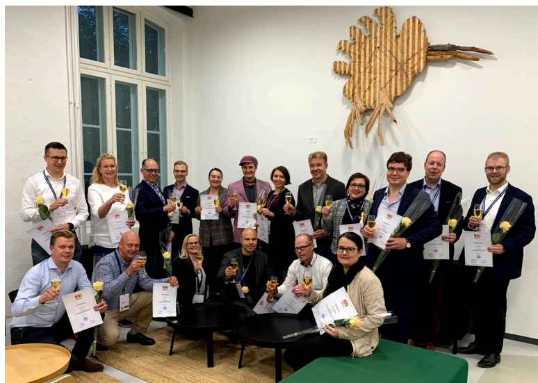
HHJ-kurssin syksyn 2020 valmistuneet.

Kurssilla käsitellään mm. hallituksen vastuita ja riskienhallintaa, kokoonpanoa ja roolia erityisesti pk-yrityksen näkökulmasta ja vahvasti käytäntöön soveltaen yritysmerkien kautta. Kurssi sisältää neljä puolen päivän jaksoa sekä ryhmätyön ja lukupaketin.