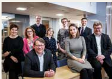
Helsingin seudun kauppakamarin asiantuntijat.

Tarvitsetko lakineuvontaa verotuksesta, taloushallinnosta, työsuhdeasioista tai vaikka yrityksen kauppasopimuksista. Helsingin seudun kauppakamarin asiantuntijat ja lakimiehet vastaavat kysymyksiisi.